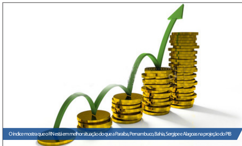
O índice mostra que o RN está em melhor situação do que a Paraíba, Pernambuco, Bahia, Sergipe e Alagoas na projeção do PIB

Além dos fatores citados por Saldanha, o governo segue investindo em legislações adequadas para cadeia do leite/queijo e a carnicultura, em pequenos produtores e as atividades de pecuária, bem como a agricultura irrigada e beneficiamento de