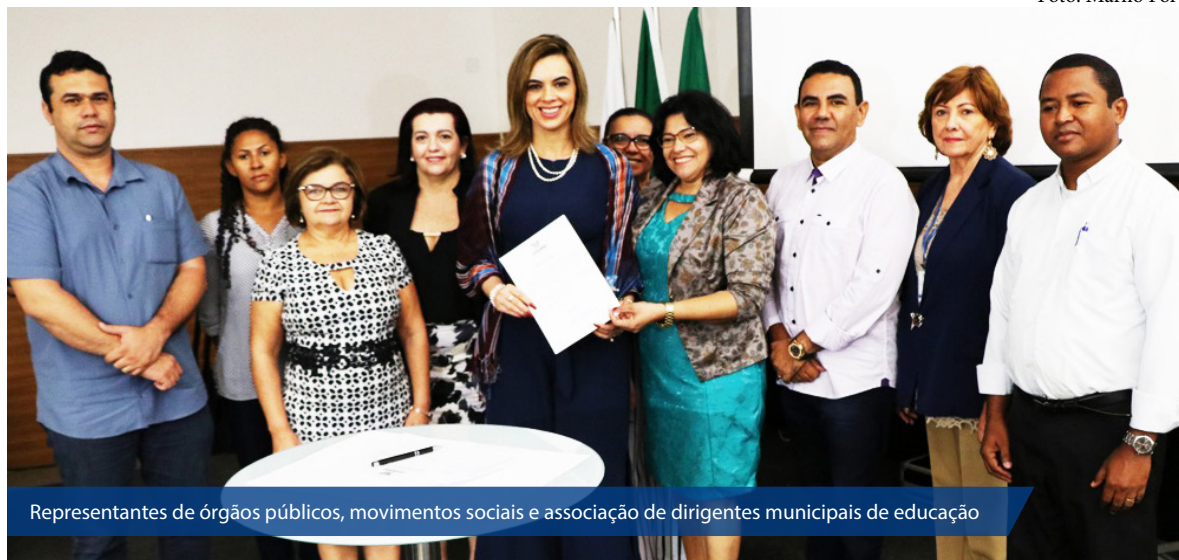
Representantes de órgãos públicos, movimentos sociais e associação de dirigentes municipais de educação