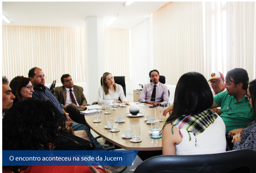
O encontro aconteceu na sede da Jucern

De acordo com a Vigilância Sanitária, as vistorias fiscalizatórias são feitas conforme a natureza do produto. Por exemplo, se o empreendedor fabrica o produto em casa, mas também o manipula no próprio veícu-